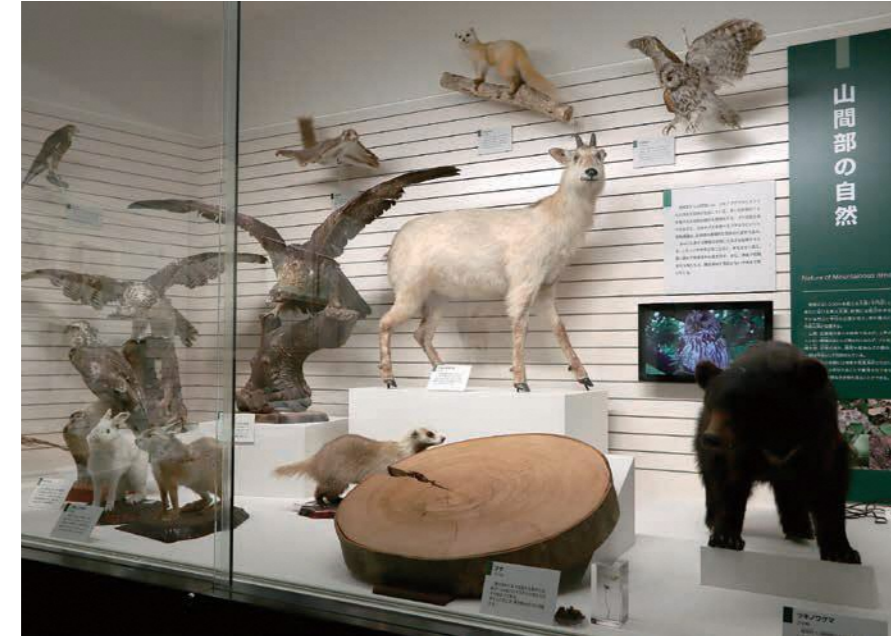
博物館の標本たち

博物館が植物標本や鳥獣標本を集めている理由と、これらの標本を未来に届けるために現在直面している課題を紹介します。